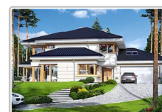
dom jednorodzinny z garażem - projekt domu Dom z widokiem