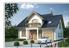
dom jednorodzinny z garażem - projekt domu APS 261