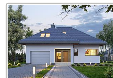
dom jednorodzinny z garażem - projekt domu E-158