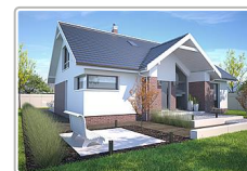
dom jednorodzinny bez garażu - projekt domu Tampa