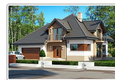
dom jednorodzinny z garażem - projekt domu Opalek II N 2G